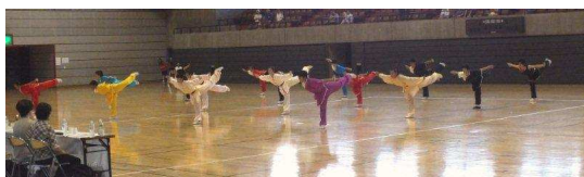
中国武術隊の息の合った表演